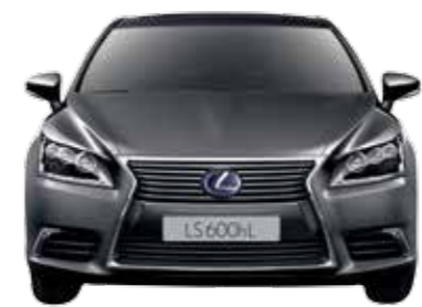
רוחב 1875 מ"מ גובה 1480 מ"מ