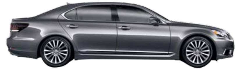
בסיס גלגלים 3090 מ"מ אורך כלי 5210 מ"מ